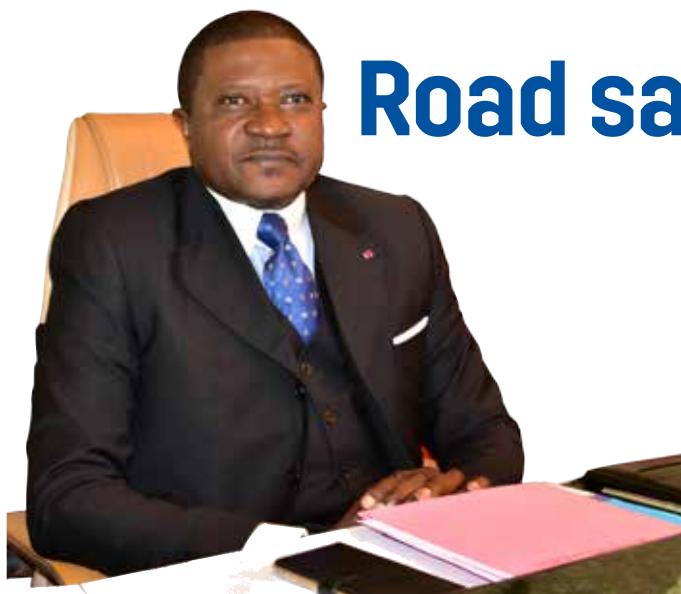
Jean Ernest Masséna NGALLE BIBEHE Minister of Transport