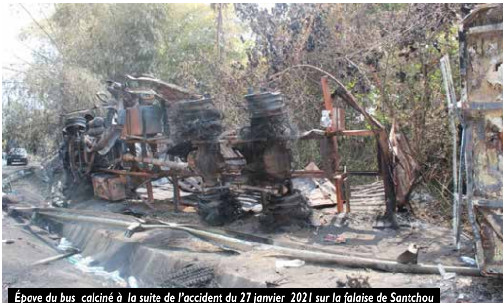
Épave du bus calciné à la suite de l'accident du 27 janvier 2021 sur la falaise de Santchou

Leur usage inapproprié par les conducteurs de véhicules automobiles et motocycles est très souvent à l'origine de nombreux accidents de la circulation dus à