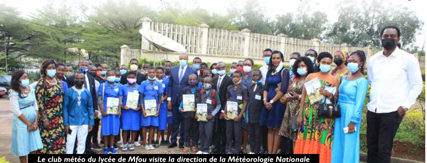
Le club météo du lycée de Mfou visite la direction de la Météorologie Nationale