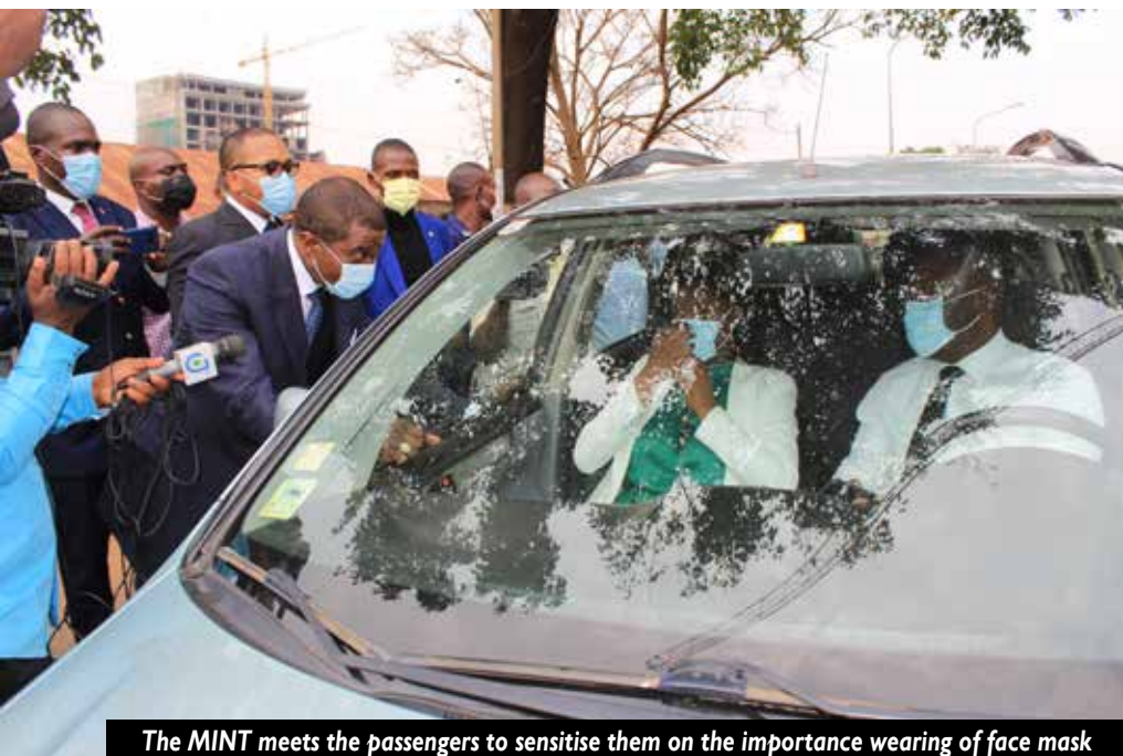
The MINT meets the passengers to sensitise them on the importance wearing of face mask

The Minister of Transport on March 10, 2021 signed a press release to reiterate the measures taken by his Ministry to fight against this pandemic. He equally made a tour at some bus stops and travel agencies to ensure, said measures were fully implemented.