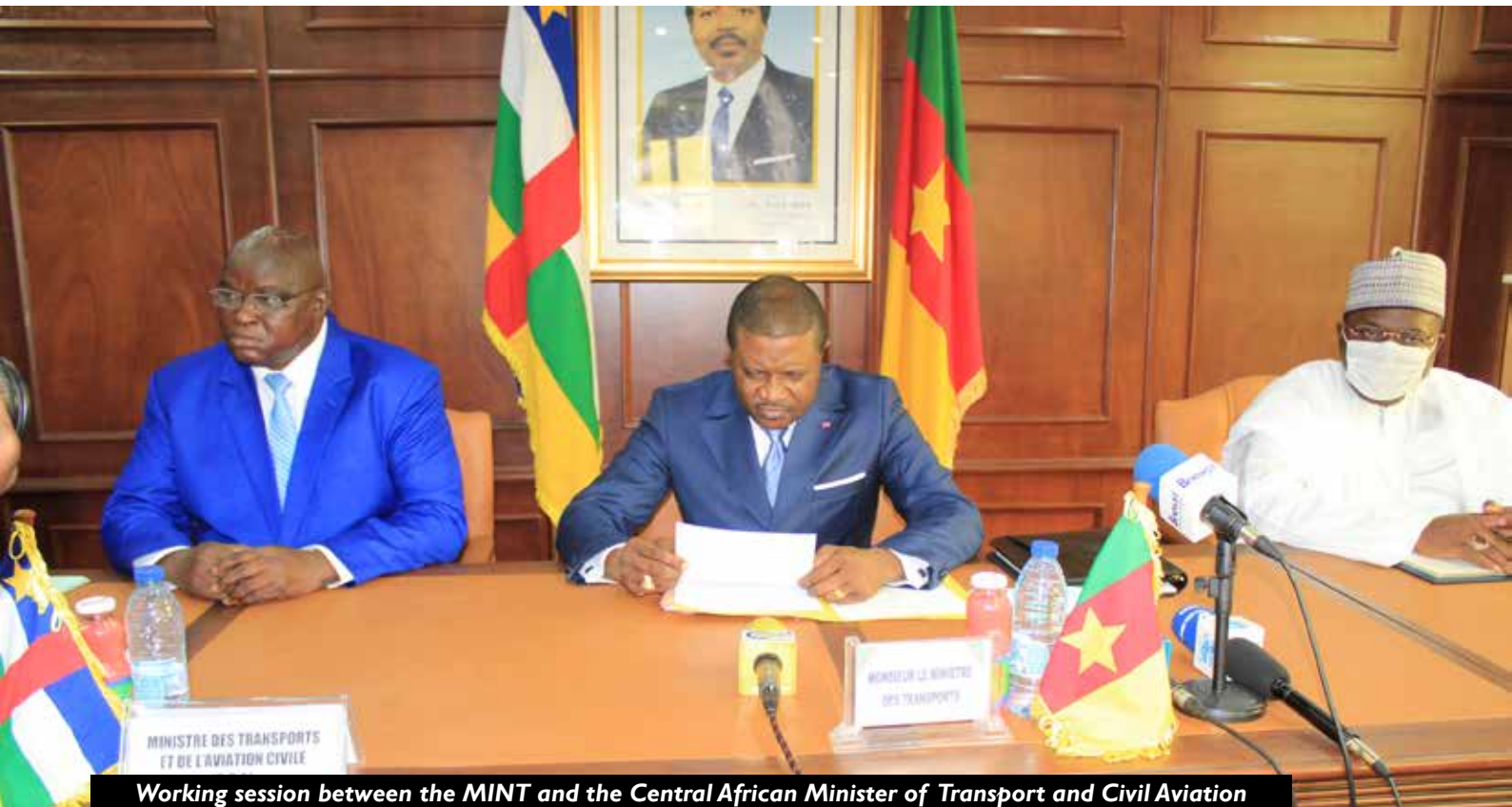
Working session between the MINT and the Central African Minister of Transport and Civil Aviation

The Minister of Transport and the Central African Minister of Transport and Civil Aviation, Arnaud ABAZENE DJOUBAYE, held a working session which was attended by the Minister Delegate to the Minister of Transport, the Ambassador of Central African Republic to Cameroon, the Directors General of the Cameroonian and Central African Customs, representatives of the General Delegation of National Security and the State Secretariat for Defence in charge of the National Gendarmerie, the General Manager of the Douala Port Authority, and Cameroonian and Central African transport operators.