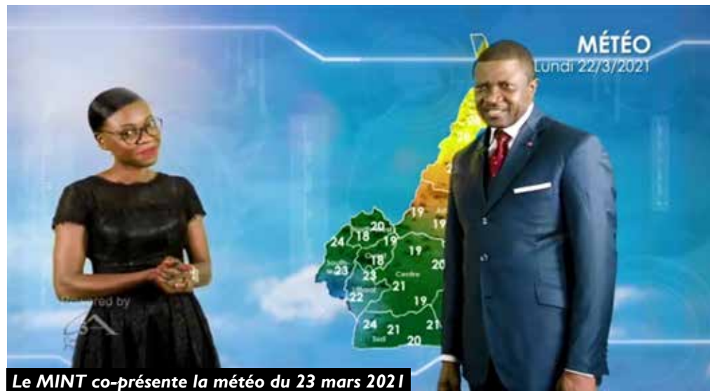
Le MINT co-présente la météo du 23 mars 2021

Bien avant, dans son adresse, le ministre des Transports a relevé que dans le cadre du lancement de la décennie 2021-2030 des Nations Unies pour les sciences océaniques au service du développement durable, il est envisagé un vaste chantier de réhabilitation et de modernisation de toutes les infrastructures météorologiques qui a commencé par la formation au niveau national des professionnels de la météorologie, dans les Ecoles nationales supérieures polytechniques de Yaoundé et de Maroua. Ces jeunes professionnels participent à la veille météorologique ainsi qu'à la fourniture d'informations utiles aux secteurs d'activités tributaires du temps et du climat à l'instar de l'agriculture, des transports et de la gestion des risques de catastrophes. En matière de coopération technique, Il a poursuivi en indiquant que l'Allemagne envisage, dans les tous prochains jours, la mise à disposition au ministère des Transports, des données météorologiques historiques de notre pays et depuis le 17 mars 2021, le ministre des Transports assure la présidence de la Conférence ministérielle africaine sur la météorologie.