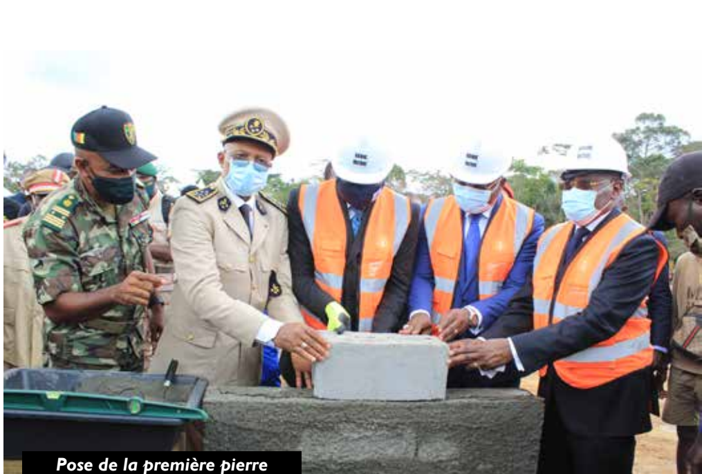
Pose de la première pierre