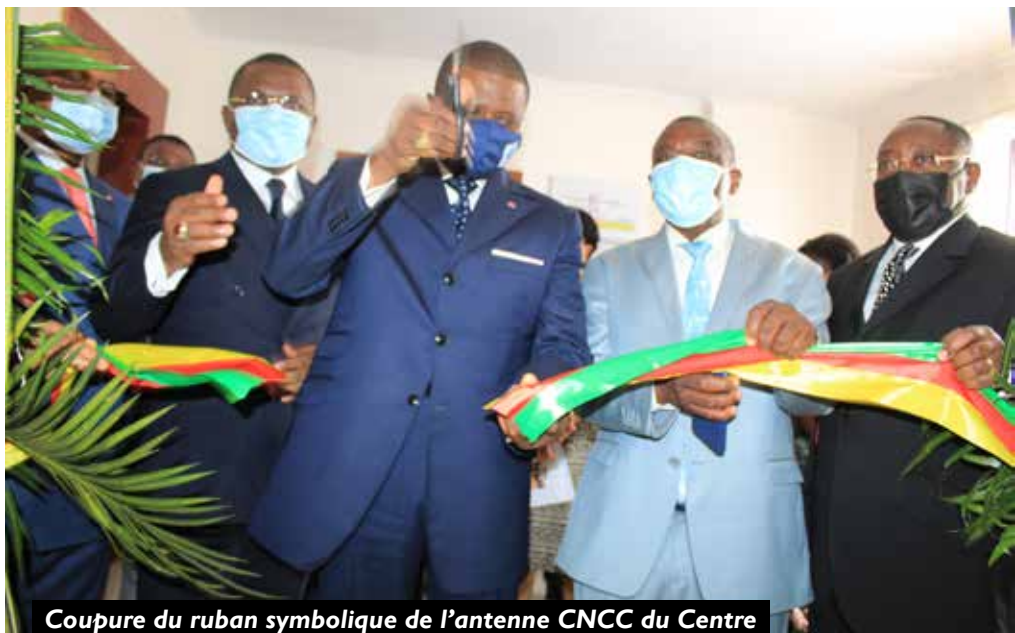
Coupure du ruban symbolique de l'antenne CNCC du Centre